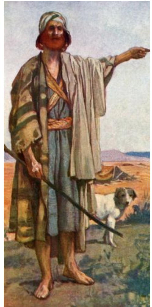
De profeet Amos, schilderij van James Tissot.

Amos is de naam van een boek in de bijbel , dat genoemd is naar zijn auteur de profeet Amos, die profeteerde in de 8e eeuw vóór Christus.