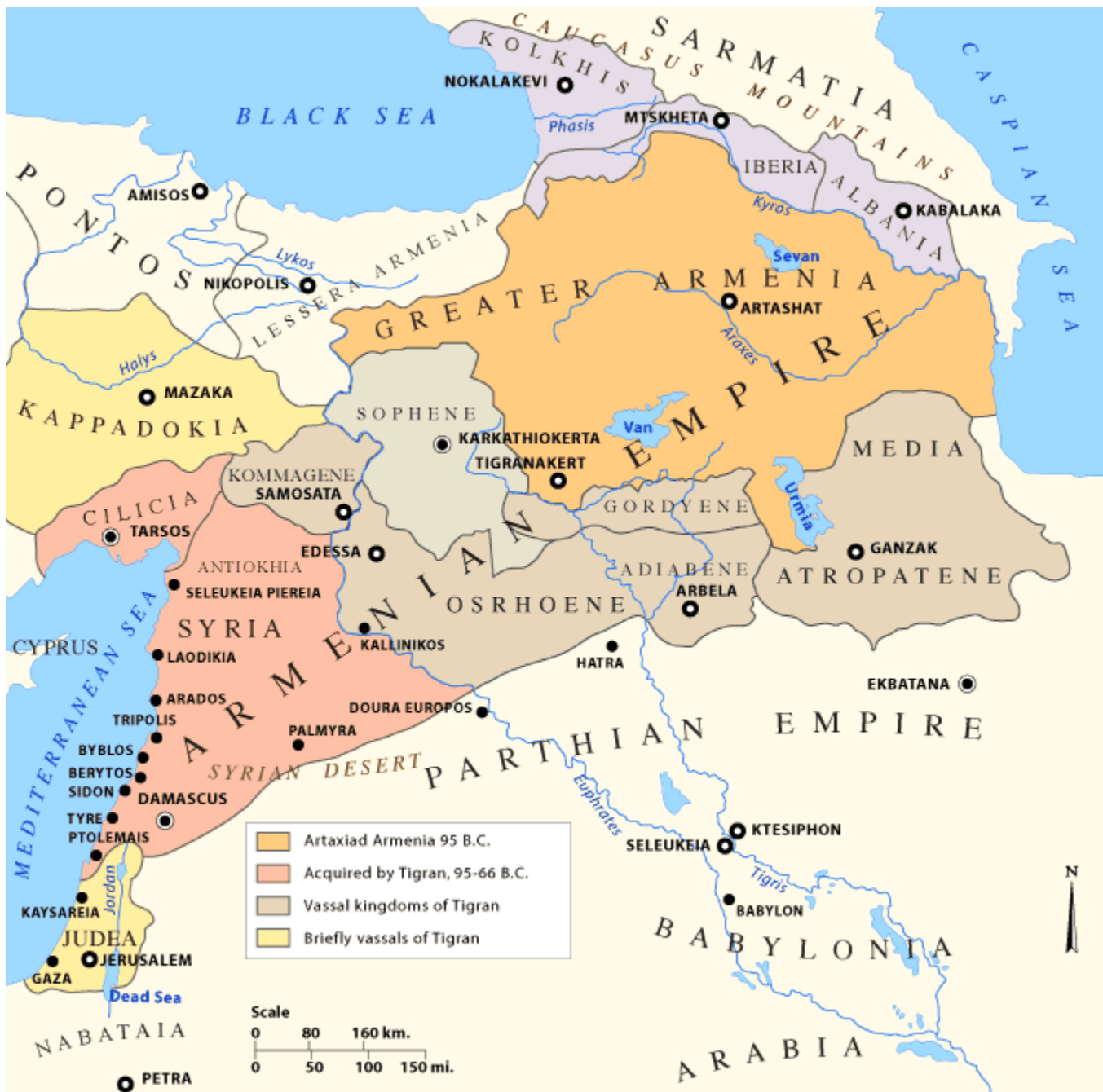
Kaart [1] : Uitbreiding van het Armeense rijk

In deze eeuw neemt in het Nabije Oosten de omvang van het Armeense rijk toe. Onder de regering van Tigranus II de Grote bereikt Armenië het land, zij het voor korte tijd, de status van de sterkste staat ten oosten van de zich uitbreidende Romeinse Republiek. Tigranus II was verwickeld in vele geschillen met zijn tegenstanders zoals de Parthen, de Seleuciden en de Romeinen.