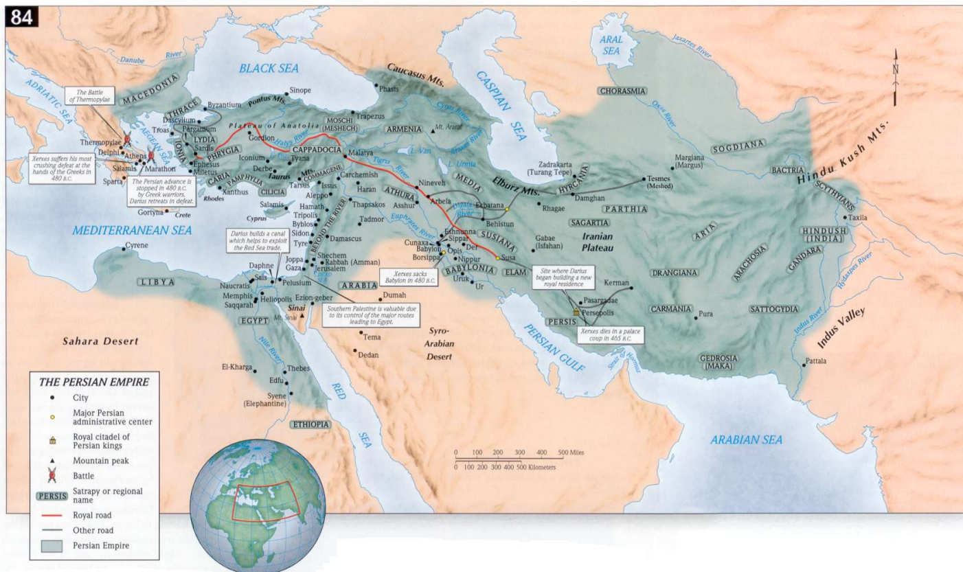
Kaart 2. ? : Perzische rijk (Klik op de kaart om deze te vergroten)

Onder Xerxes zien wij het inwendige leven van de staat volkomen ontwikkeld. Maar met zijn in Griekenland geleden nederlagen, na welke hij zich geheel aan het haremleven en aan alle denkbare uitpattingen overgaf, begint het verval, dat reeds bij zijn dood zich begint te openbaren.