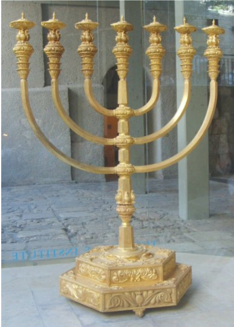
Fig. Menora gemaakt door het Tempelinstituut te Jeruzalem.

De Joden kennen ook een negenarmige kandelaar, de chanoekia , die bij het chanoeka-feest wordt gebruikt.