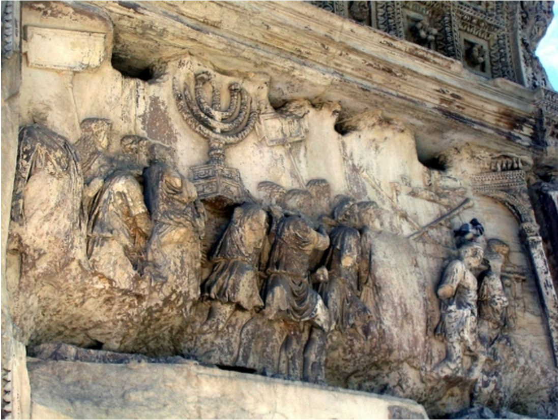
Fig. Op de Titusboog te Rome is te zien hoe de Romeinen de zevenarmige kandelaar (menora) en andere voorwerpen uit de tempel als krijgsbuit in triomf tonen. (Klik op de foto om deze te vergroten.)

De menorah die in de Tweede Tempel licht verspreidde, werd door de Romeinen onder leiding van veldheer Titus als overwinningsbuit meegenomen naar Rome, wat te zien is op de ereboog van Titus in Rome.