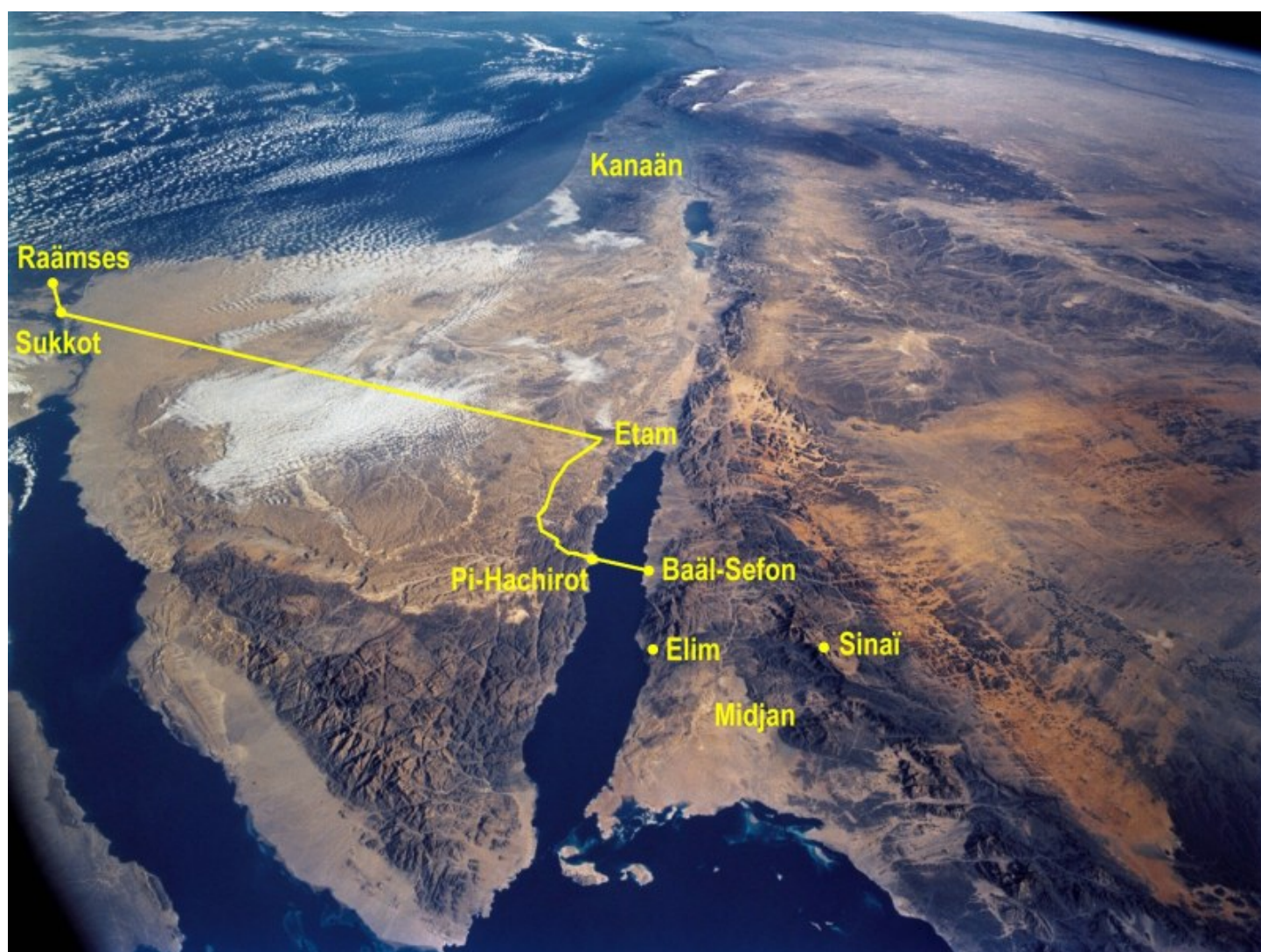
Kaart: Sinai gelokaliseerd ten oosten van de golf van Akaba. Het volk Israel stak bij Pi-Hachiroth de Schelfzee over.

Een vermoedelijke reisroute en plaats van oversteek laat de volgende kaart zien: