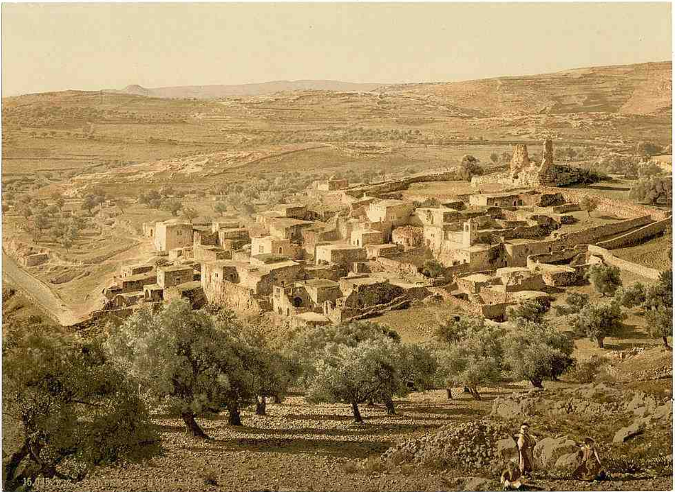
Foto [2] : Bethanië, ca. 1890-1900 (Klik op de foto om in te zoomen)

Bethanië is ook de naam van een gehucht op de oostelijke oever van de Jordaan, waar Johannes doopte, zie artikel Bethanië (aan de Jordaan)