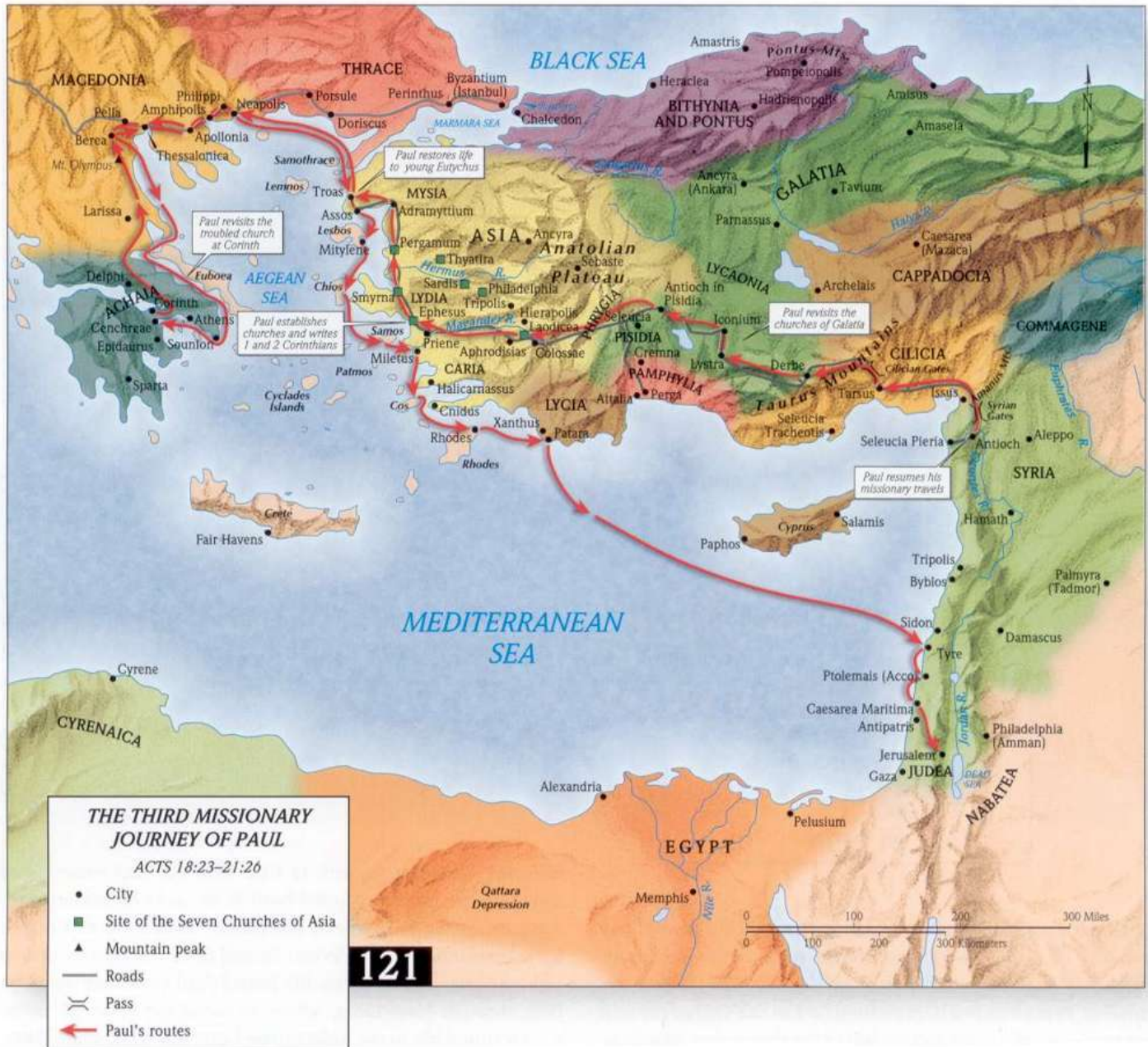
Kaart [2] : Paulus' voer over van Patara naar Tyrus in Fenicië (Kik op de kaart om in te zoomen)