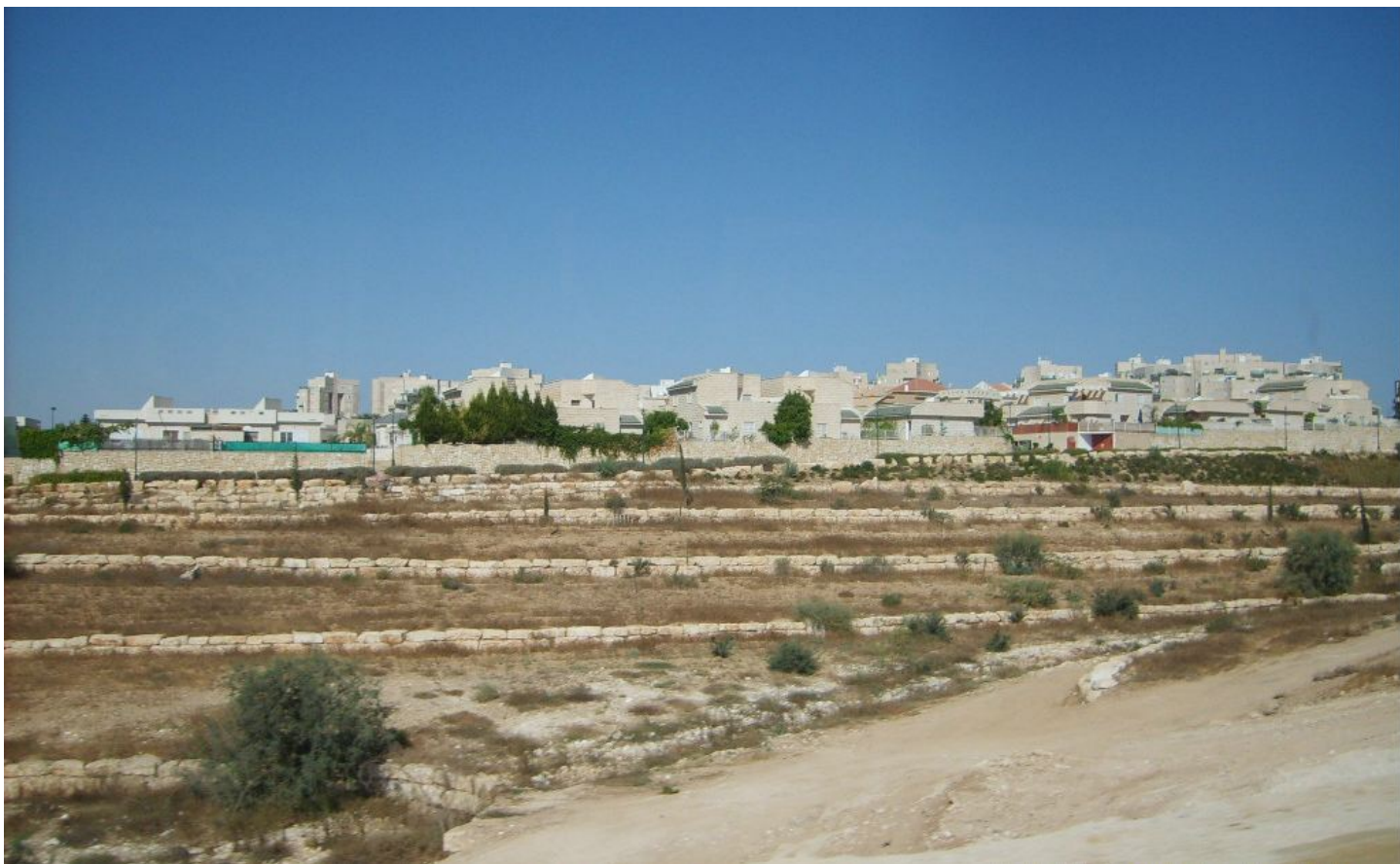
Berseba gezien vanaf de weg naar Eilat.

In 2008 was de stad Berseba met 186.800 inwoners de zesde stad van Israël.