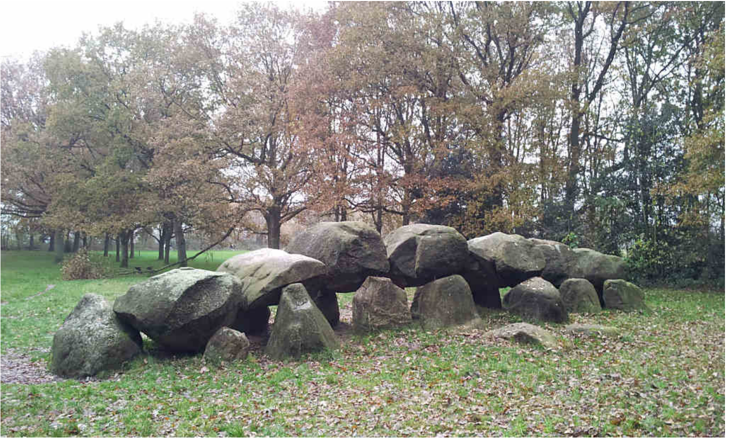
Foto: Hunebed bij Rolde, Drenthe. Foto: Kees Langeveld, 18 nov. 2013

ca. 300 v.C.: Vanuit Duitsland dringen de Germanen het land binnen.