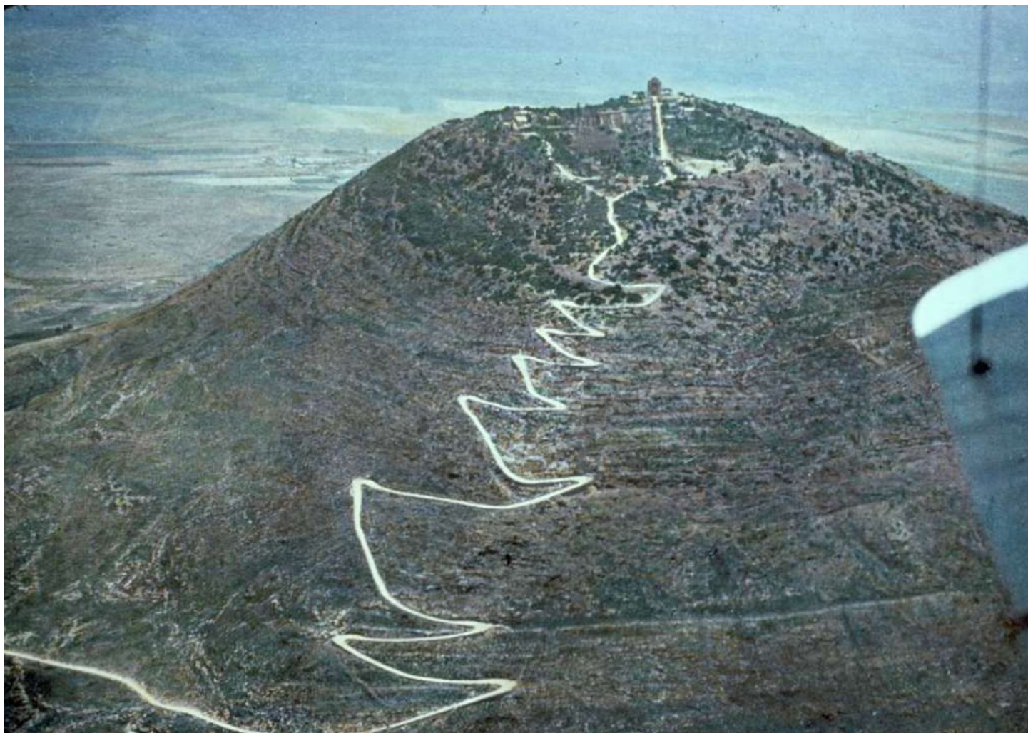
Foto: Tabor vanuit een vliegtuig gezien, ca. 1950-1977 [2] .