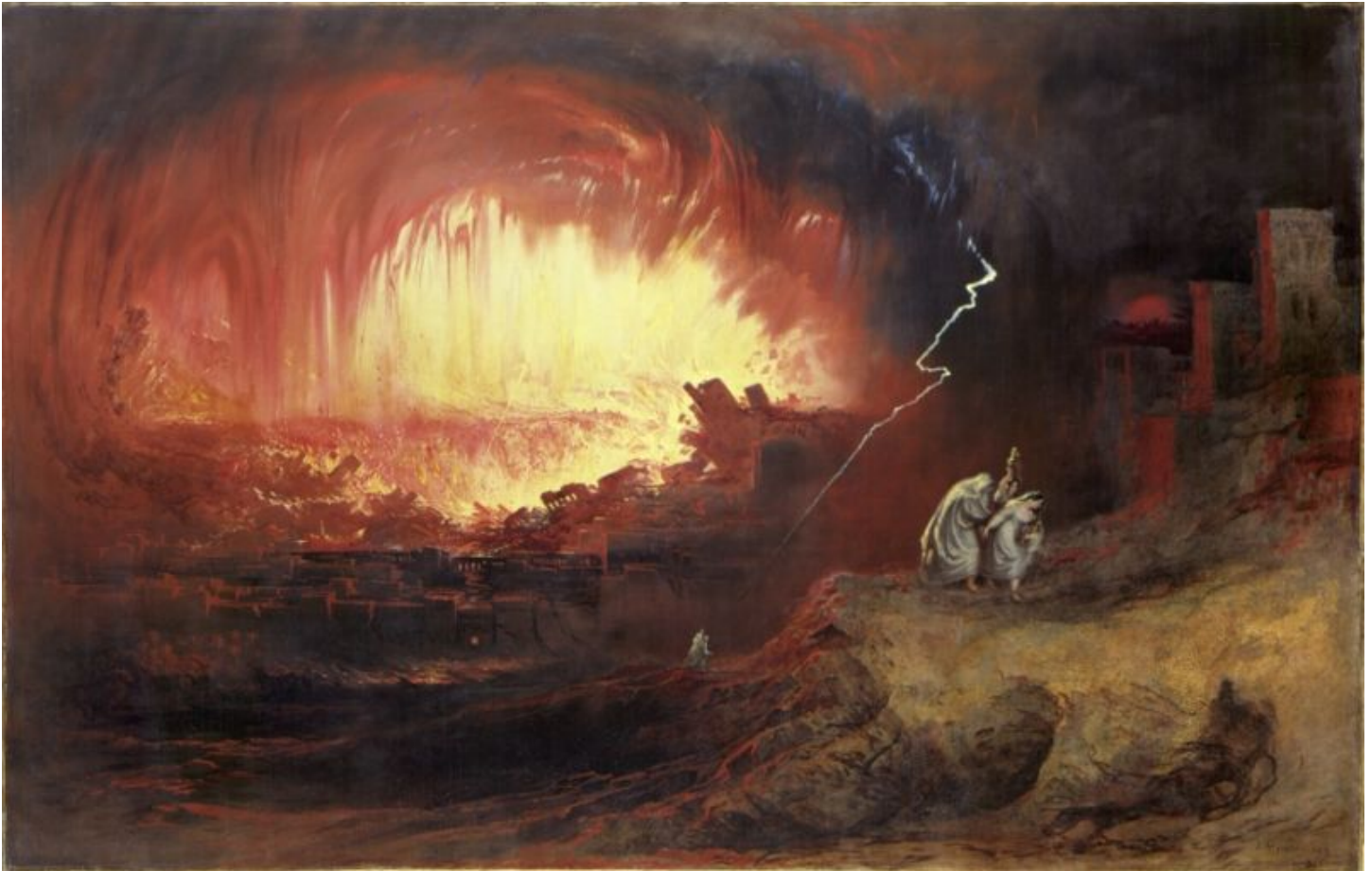
'De verwoesting van Sodom en Gomorra', schilderij van John Martin (1789-1854), 1852 [3] .

Ge 19:28 Hij keek uit over Sodom en Gomorra en over heel het gebied van de vlakte. En zie, hij zag dat er rook van dat land opsteeg, zoals de rook van een oven.