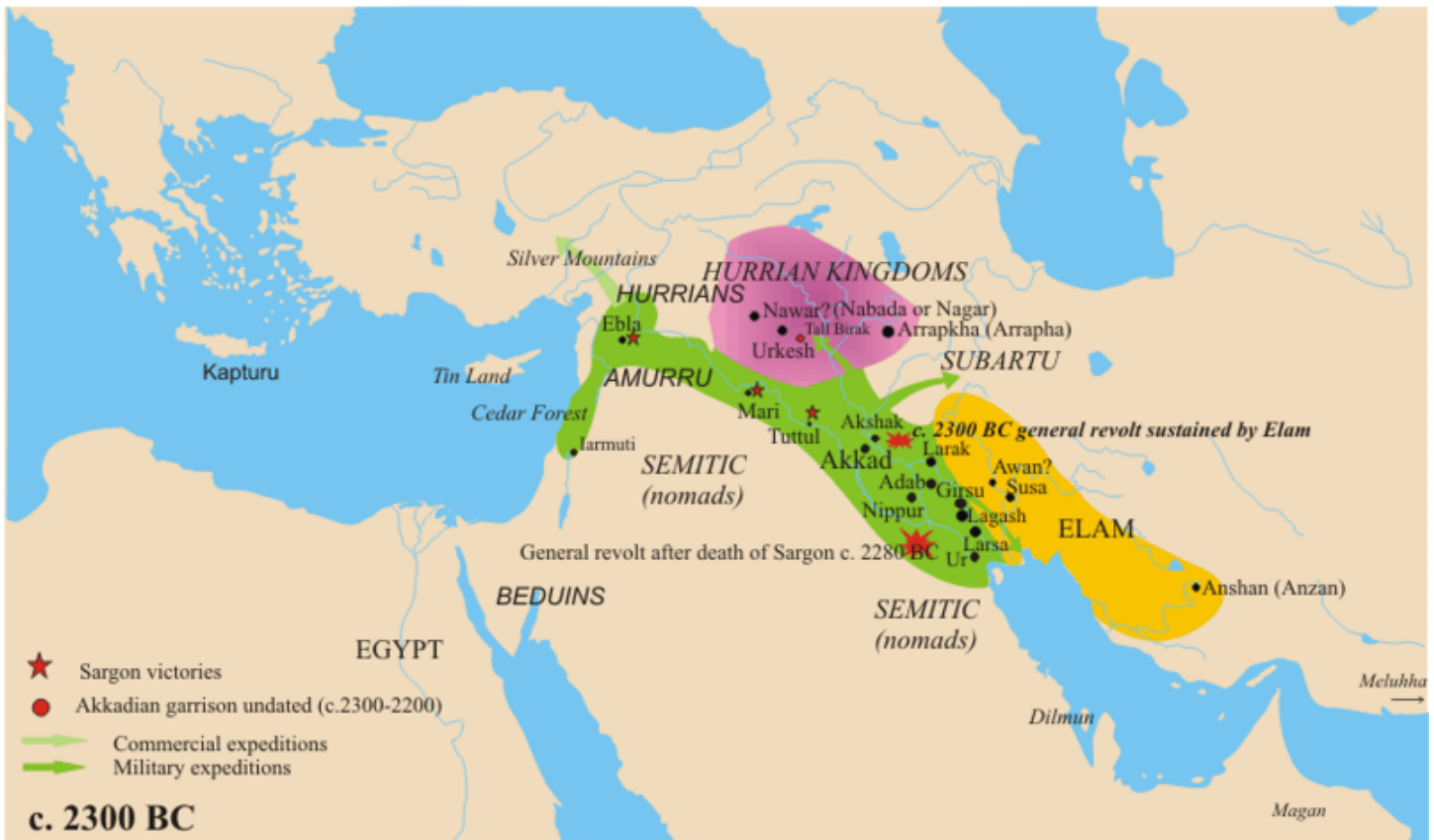
Kaart{template.verwijzing(1)}: Akkadische rijk (groen) ca. 2300 v.C.

Het noordelijke deel van Mesopotamië, waar Eufraat en Tigris elkaar het dichtst naderen, ten noorden van het eigenlijke Soemer, kwam door de dominantie van de hoofdstad Akkad eveneens bekend te staan als "Akkad". Er ontstond een traditie waarbij de heersers zich "koning van Sumer en Akkad" gingen noemen, als een twee-eenheid. Deze traditie is door de latere Babylonische koningen overgenomen.