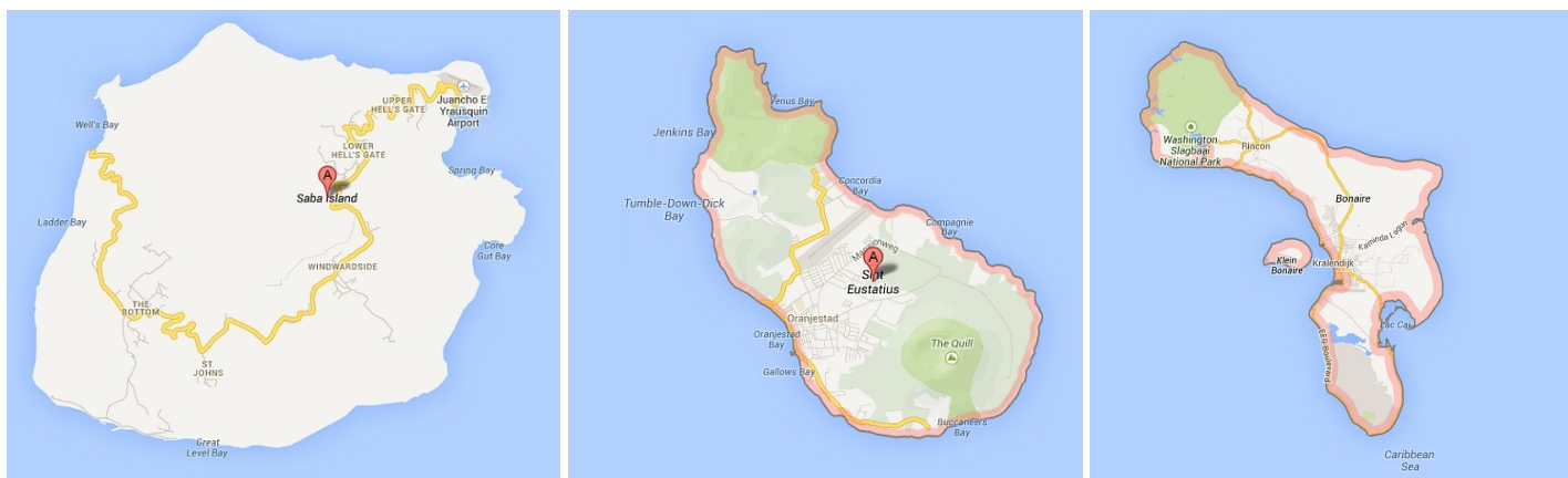
Van links naar rechts: Saba, Sint Eustatius en Bonaire (Google Maps, 2013).

Wat typeert Nederland? Wat is kenmerkend ? [39] Het lage, vlakke en groene land, de verovering van land op de zee en de beheersing van het water (duinen en dijken, molens, delta-werken), de handelsgeest, de tolerantie, de lomphheid, de vrijgevigheid, bollenvelden (tulpen), klompen, het vrije drugsbeleid, de relatief grootste porno-productie ter wereld (in 2006 [40] ), Amsterdam als homo-hoofdstad van Europa, het poldermodel van onderhandelen, de vele fietsers en fietspaden. Nederland was het eerste land ter wereld dat het ' homohuwelijk ' invoerde. Nederland is het land van de 'vergadertijgers': waar naar verhouding het meest vergaderd wordt in de wereld (anno 2016). Nederland is Europa's grootste exporteur van fietsen (anno 2016).