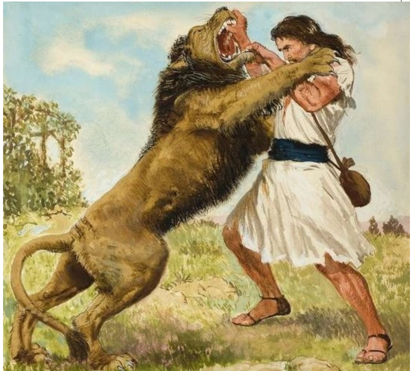
Simson verscheurt een leeuw.

Simson werd tussen Zora en Estaol begraven, in het graf van zijn vader Manoah.