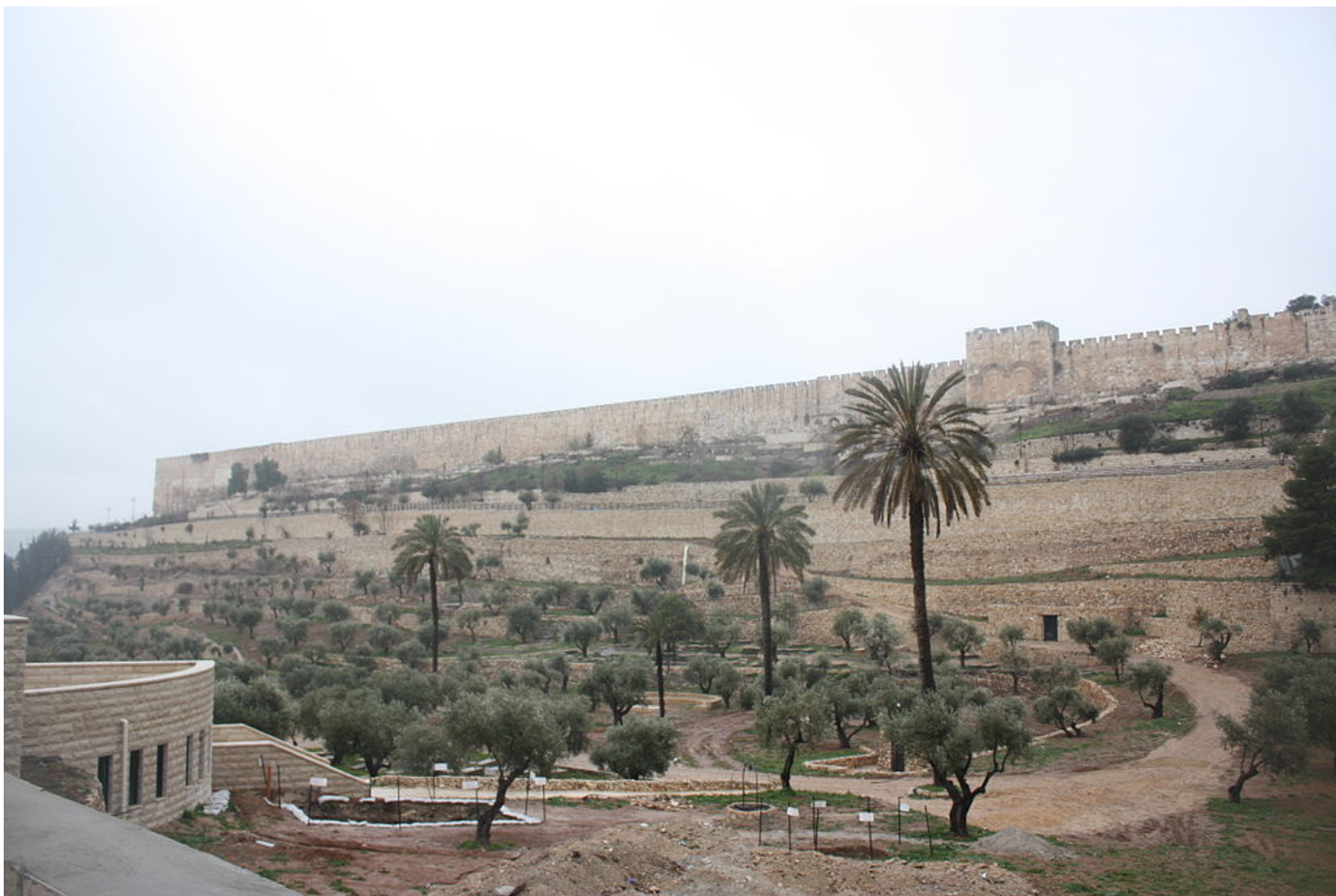
Foto: Oostaanzicht van een deel van de berg Moria. De poort in de oude stadsmuur is de Gouden Poort (of Oostpoort). Foto genomen nabij Gethsemané [4] .

Golgotha lag op een uitloper van de berg Moria [2] .