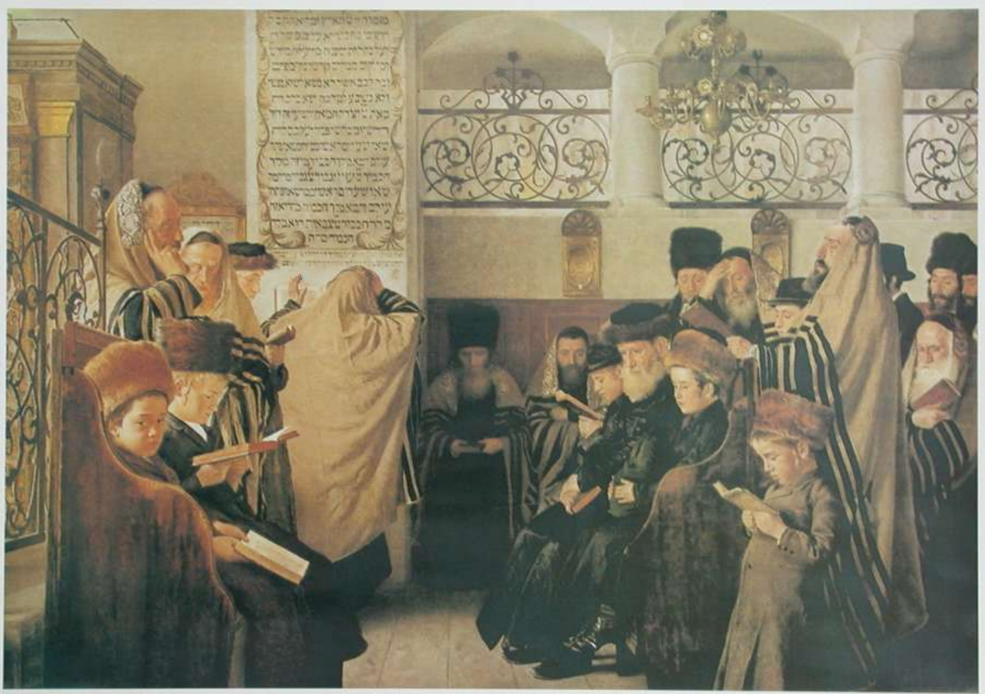
'Day of Atonement' (= Dag van Verzoening), olieverfschilderij van Isidor Kaufman (1853-1921), gemaakt vóór 1907 [1] . Joden komen bijeen in de synagoge.