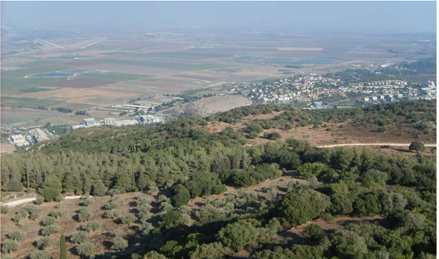
Foto [4] : Vanaf het hoogste punt van de berg Karmel uitzicht op de vlakte van Jisreël en op de plaats Jokneam met een tel (ruïneheuvel), de kale bult in het midden van de foto.

Naar deze berg heten de Karmelieter bedelmonniken in de Rooms-katholieke kerk.