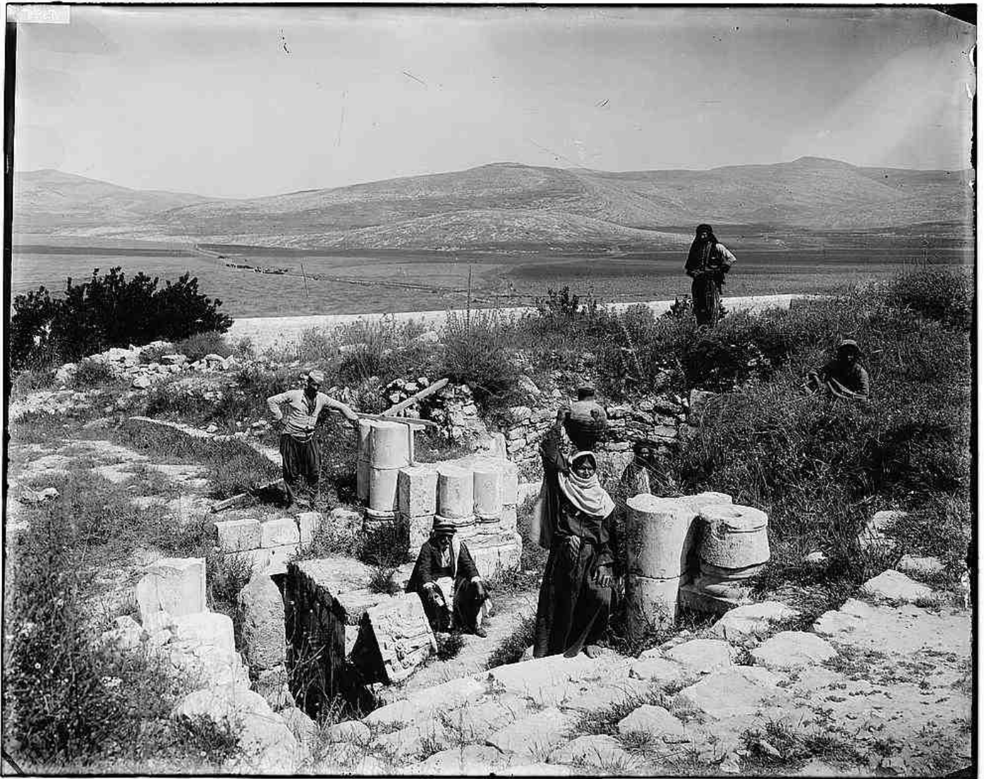
Foto [1] : Jacobs welput bij Nabloes (Sichem). Foto gemaakt ca. 1898-1914.