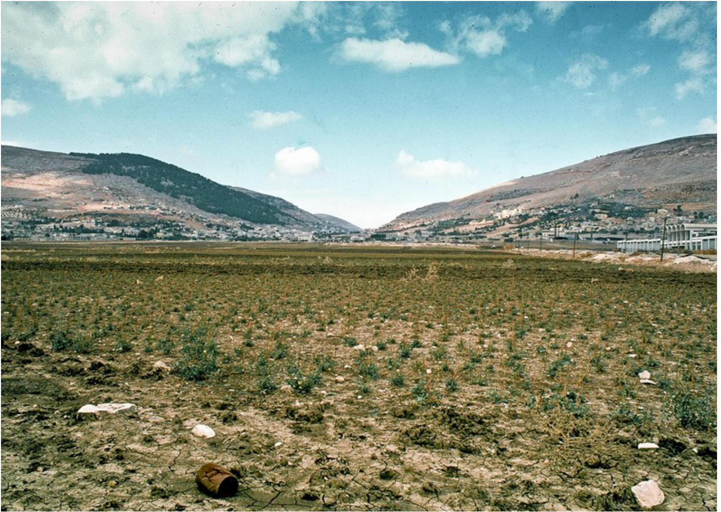
Foto [7] : links de berg Gerizim en rechts de berg Ebal. Daartussen in het dal (niet zichtbaar) het dorp Nabloes (= Sichem) en de Jacobsbron.