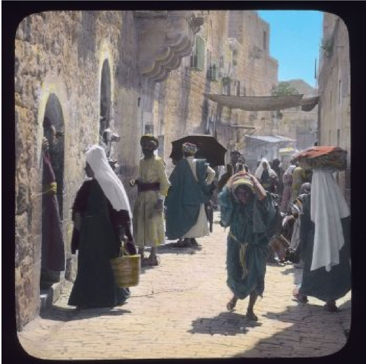
Foto: Hoofdstraat in Bethlehem ca. 1915

In 1917 kwam Bethlehem met heel het land van Israël onder Brits bestuur. De eeuwen durende heerschappij van de Turken was voorbij.