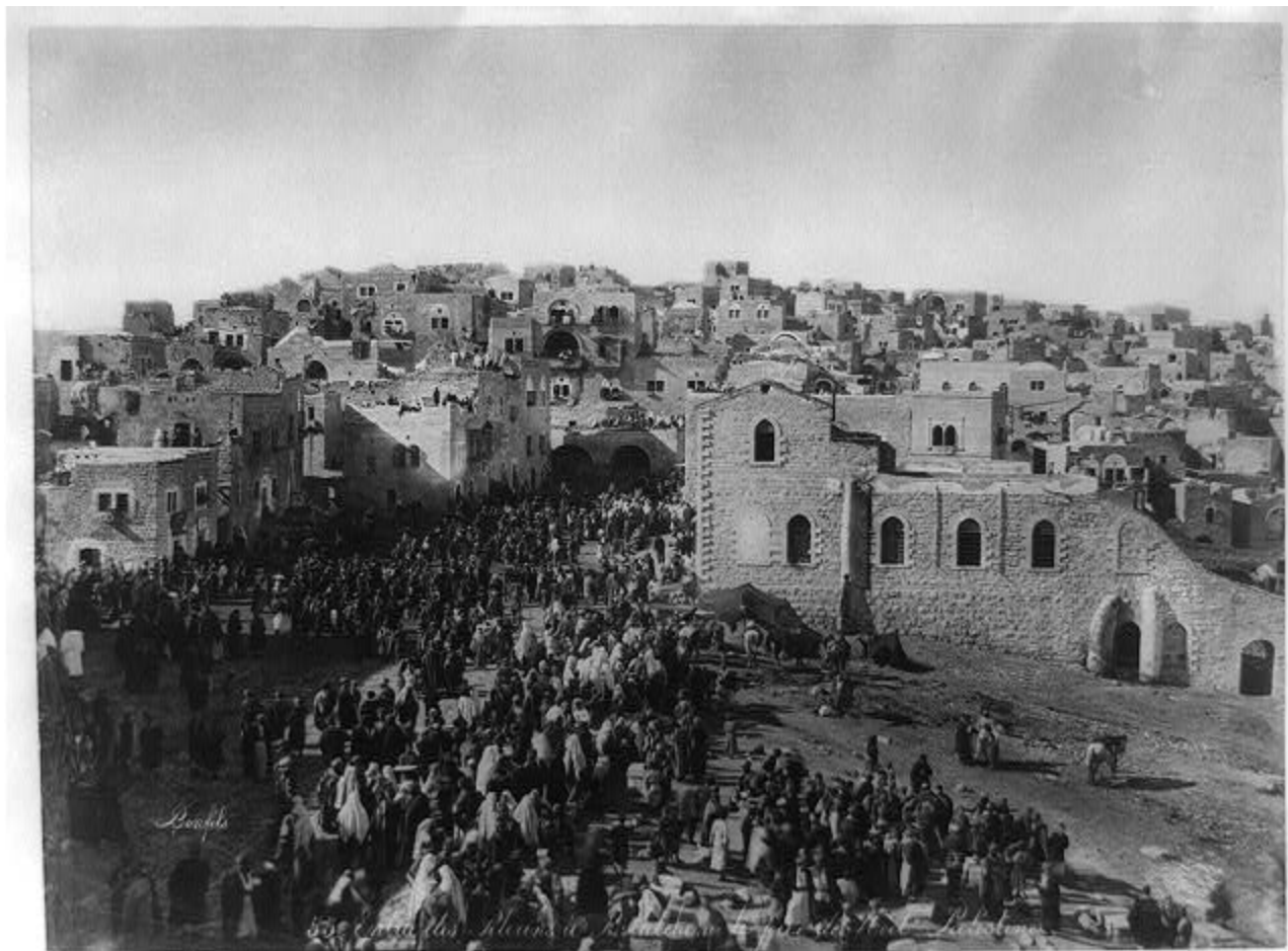
Foto: In de kersttijd trekt Bethlehem veel bezoekers (ca. 1890-1930).