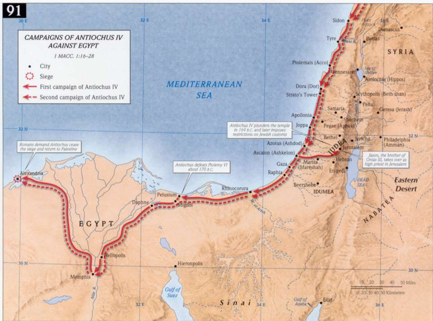
Kaart [3] : Campagnes van Antiochus IV Epifanes tegen Egypte. (Klik op de kaart om deze te vergroten)