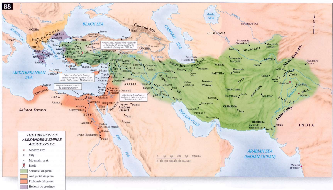
Kaart: De verdeling van het rijk van Alexander de Grote ca. 275 v.C. [1] Het Seleucidische rijk is groen gearceerd. Klik desgewenst op de kaart om in te zoomen.

De Schrift verschaft geen volledige wereldgeschiedenis uit de tijd na Alexanders dood. Zij trekt haar kring nauwer (vgl. Jes. 14:5) en handelt alleen over de beide rijken, die uit Alexanders nalatenschap zijn voortgekomen, in Egypte en Syrië, welke op het lot van het heilige land de grootste invloed zouden uitoefenen.